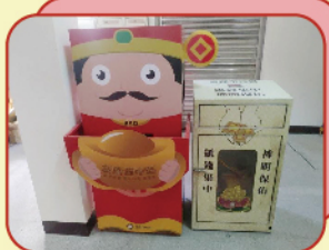
▲ 紙錢集中箱示意圖

為避免同一時段大量焚燒或露天燃燒金紙產生之煙霧影響附近居民健康，造成公共安全事故發生機率，桃園市環境保護局與民政局共同宣導紙錢集中燒政策，並於本市轄內寺廟增設200座紙錢集中箱，每逢重大節日時，各大寺廟或公墓亦設置紙錢集中專區供民眾放置，由各區中隊安排專車統一載運。