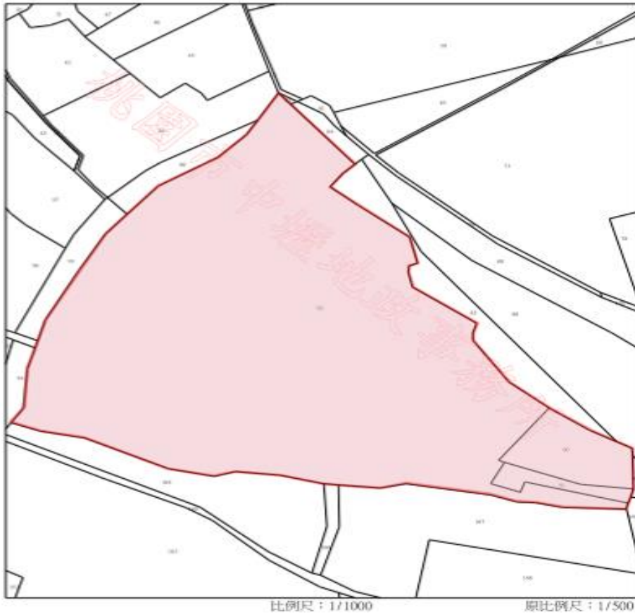
本計畫範圍地籍圖