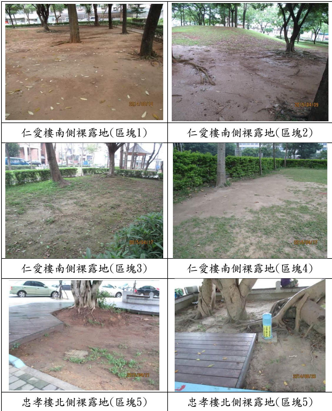
本計畫環境綠美化施作區域現況照片及說明